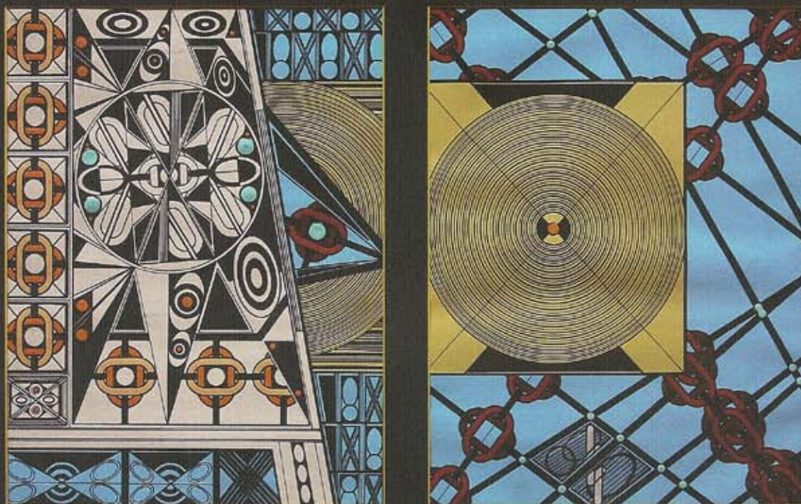
Christoph Schirmer: „binary chain“, 2011. Acryl, Lack, Tuschestift, Farbstift auf Karton (gerahmt), 60 x 80 cm

› Schirmer geht es keineswegs um eine modernisierte Illustration des mythologischen Stoffs, sondern um eine freie Kreation und Interpretation von unterschiedlichen Medien, Strategien und Quellen. Als „Kind der Bildschirmgeneration“ bedient sich der Künstler der zeitgenössischen technischen Tools und Informationsträger und schafft eine eigenständige komplexe neue Bildwelt.