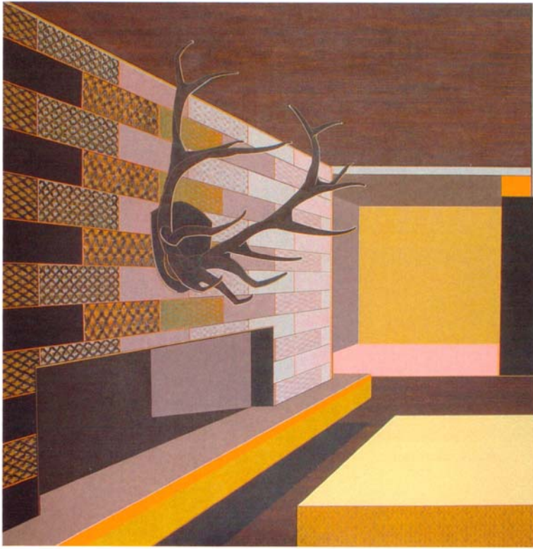
Aurelia Gratzers: „The Boss“, 2010. Acryl auf Molino, 120 x 120 cm