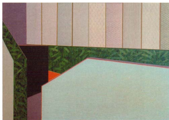
Aurelia Gratz: „Unten“, 2010. Acryl auf Molino, 70 x 100 cm

Galerie Brunnhofer Graben 3 4020 Linz Tel: 0664/38 18 104 www.brunnhofer.at/galerie art@brunnhofer.at