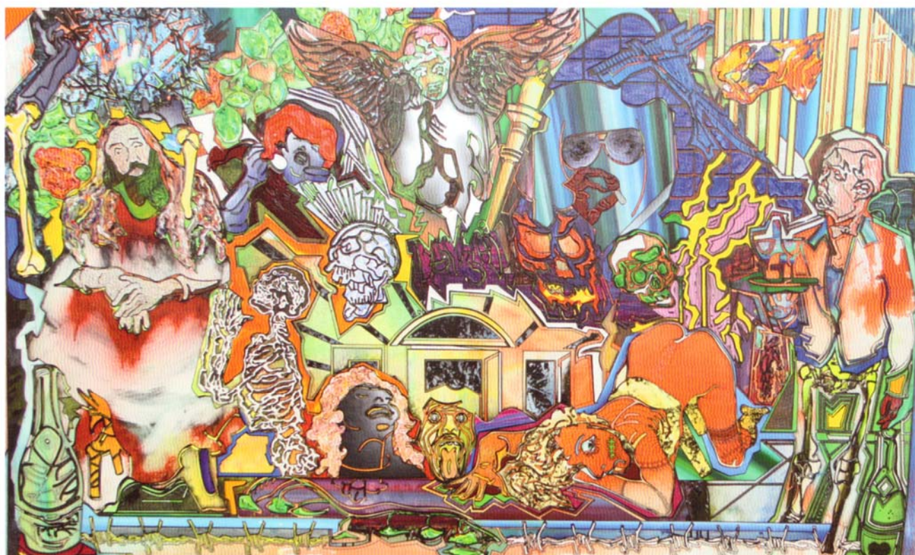
Christoph Schirmer: „last supper – mighty middlefinger version“, 2008. Acryl, Lack auf Leinwand, 120 x 200 cm

Persönlich geprägt von der Pop-Art, dem Interesse für sozialkritische und politische Kunst entwickelte Stefan Brunnhofer sein Konzept, ausschließlich junge, auf dem internationalen Markt bestehen könnende Kunst zu fördern. Von Beginn an im